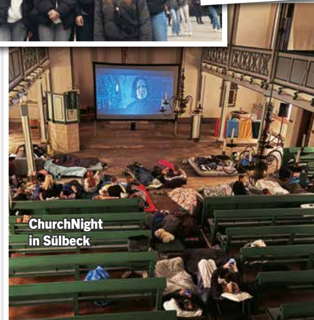
ChurchNight in Sülbeck