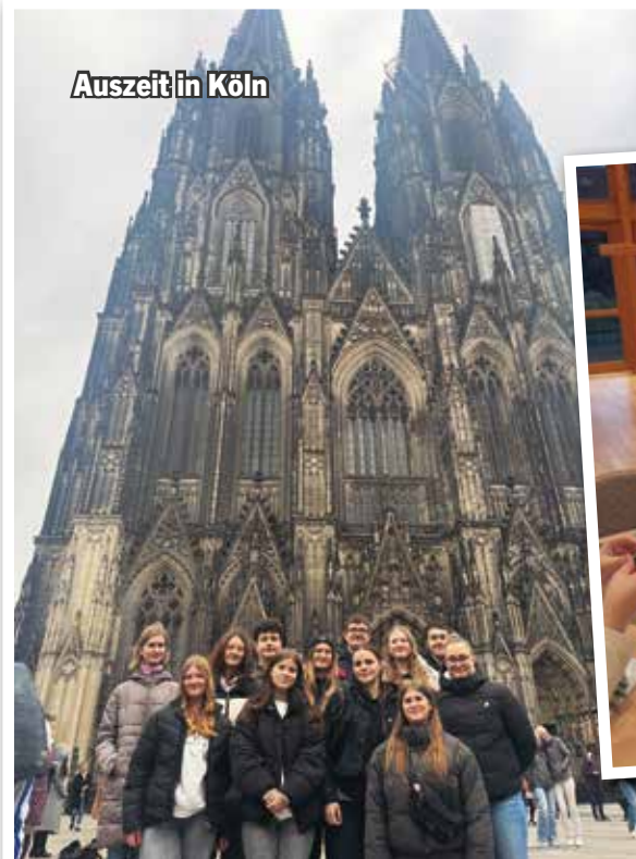
Auszeit in Köln