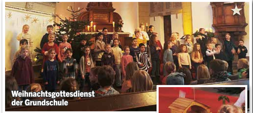
Weihnachtsgottesdienst der Grundschule