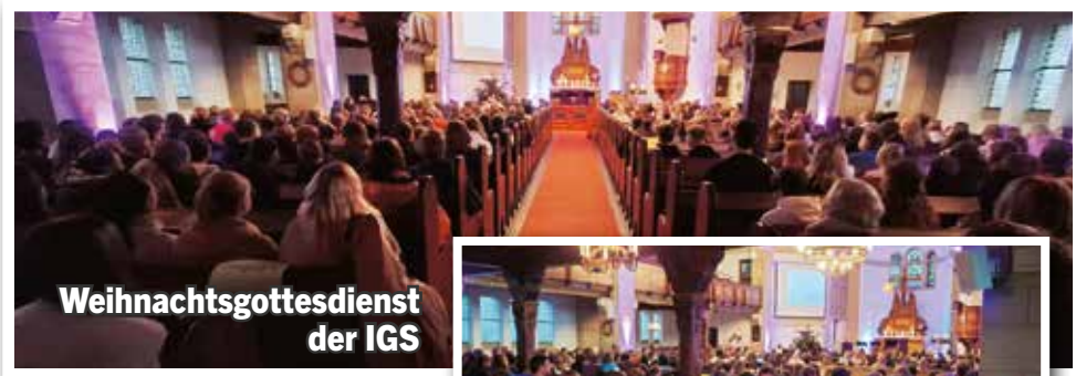
Weihnachtsgottesdienst der IGS